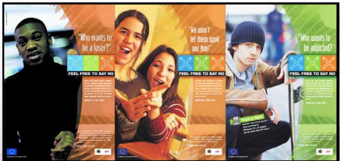
Antiraucher Kampagne allgemeine Produktionsabwicklung, Artbuying, Casting